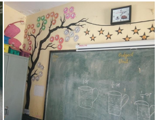
ಅಕ್ಷರ ಬೈಲಿನ ನಲಿ-ಕಲಿ ಕೊಠಡಿ.