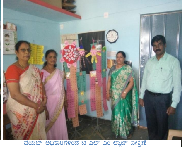
ಡಯಟ್ ಅಧಿಕಾರಿಗಳಿಂದ ಟಿ ಎಲ್ ಎಂ ಲ್ಯಾಬ್ ವೀಕ್ಷಣೆ