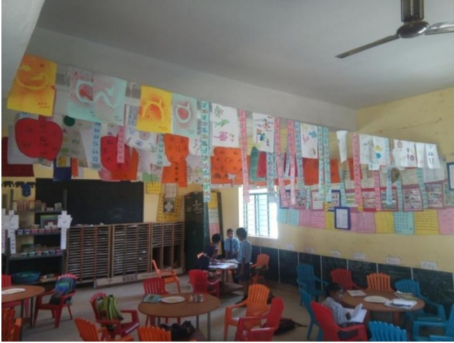
ಟೇಬಲ್ , ಕುರ್ಚಿ ಆಸನ ವ್ಯವಸ್ಥೆ ಹೊಂದಿರುವ ನಲಿ-ಕಲಿ ತರಗತಿ.