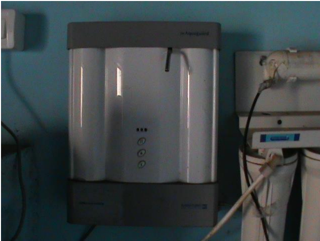
ಅಕ್ವಿ-ಗಾರ್ಡ್ ವ್ಯವಸ್ಥೆ. ಕೊಡುಗೆ: ರೋಟರಿ ಕ್ಲಬ್. ಶಿವಮೊಗ್ಗ.