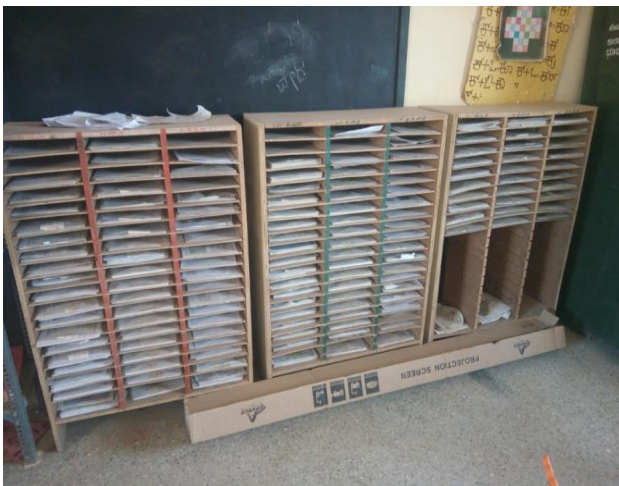
ನಲಿ-ಕಲಿ ಕಾರ್ಡ್‌ಗಳ ಜೋಡಣೆ