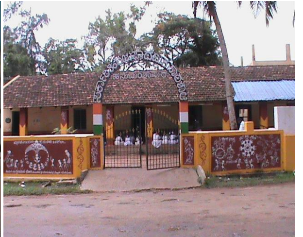
ಶಾಲಾ ಕಟ್ಟಡದ ಪೋಟೊ.