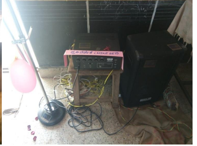
ಕಾರ್ಯಕ್ರಮ ನಡವಲು ಧ್ವನಿ ವರ್ಧಕ ದ ಸೆಟ್