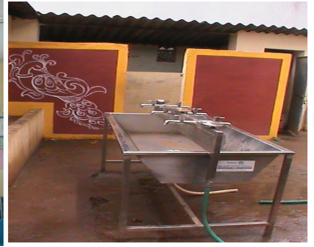
ವಾಷ್ ಬೆಸಿನ್ ಕೊಡುಗೆ: ರೋಟರಿ ಕ್ಲಬ್. ಶಿವಮೊಗ್ಗ.