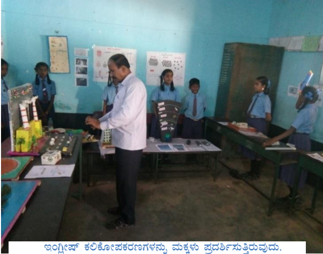
ಇಂಗ್ಲೀಷ್ ಕಲಿಕೋಪಕರಣಗಳನ್ನು ಮಕ್ಕಳು ಪ್ರದರ್ಶಿಸುತ್ತಿರುವುದು.

ಒಟ್ಟಾರೇ ಶಾಲೆಯ ಅಭಿವೃದ್ಧಿಗಾಗಿ ಶಿಕ್ಷಕ ವರ್ಗದವರು, ಗ್ರಾಮಸ್ಥರು, SDMCಯವರು ಮತ್ತು ಅಧಿಕಾರಿ ವರ್ಗದವರು ಕೆಲಸ ಮಾಡುತ್ತಿದ್ದು, ಇನ್ನೂ ಅಭಿವೃದ್ಧಿಯ ಕಾರ್ಯಗಳು ನಡೆಸಬೇಕಾಗಿದೆ.