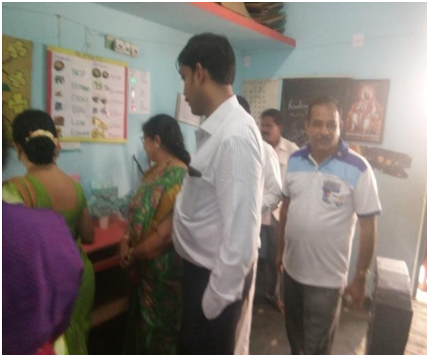
ರೋಟರಿ ಕ್ಲಬ್, ಶಿವಮೊಗ್ಗ, ಸದಸ್ಯರಿಂದ ವೀಕ್ಷಣೆ.