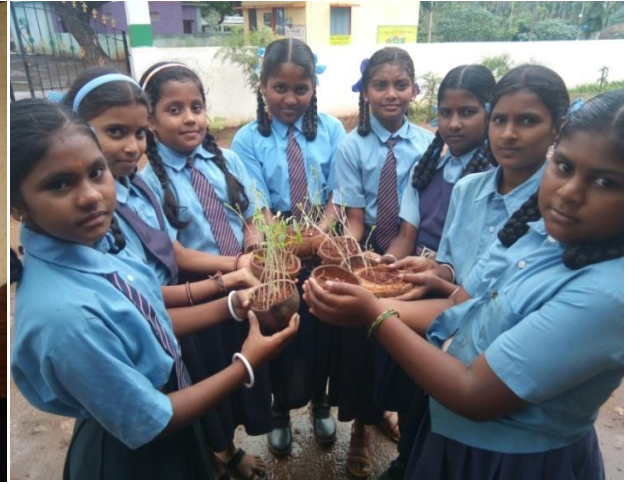
ಸಸ್ಯಗಳು ಪ್ರಚೋದನೆಗೆ ಪ್ರತಿಕ್ರಿಯೆ ನೀಡುತ್ತವೆ ಎಂಬ ಪ್ರಯೋಗದ ಪೋಟೋ