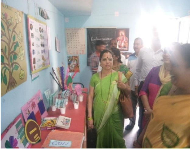
ರೋಟರಿ ಕ್ಲಬ್, ಶಿವಮೊಗ್ಗ, ಅಧ್ಯಕ್ಷರಿಂದ ವೀಕ್ಷಣೆ.