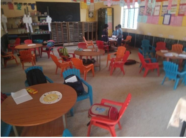
ಟೇಬಲ್ , ಕುರ್ಚಿ ಆಸನ ವ್ಯವಸ್ಥೆ ಹೊಂದಿರುವ ನಲಿ-ಕಲಿ ತರಗತಿ.