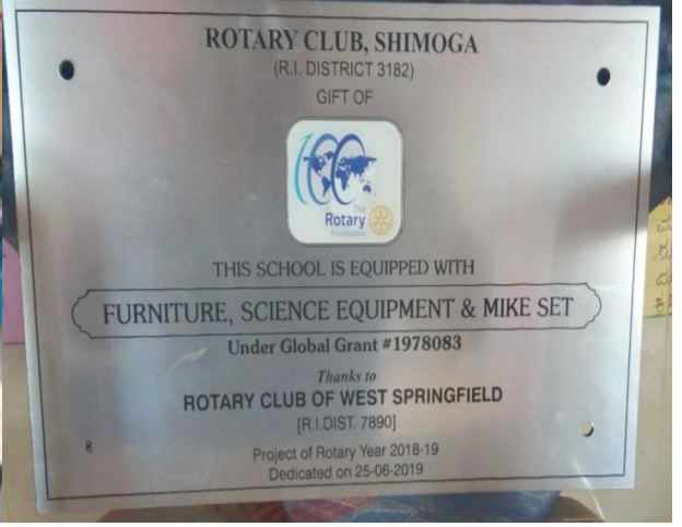
ಆಧುನಿಕ ವಿಜ್ಞಾನ ಉಪಕರಣಗಳು