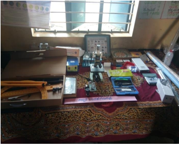
ಆಧುನಿಕ ವಿಜ್ಞಾನ ಉಪಕರಣಗಳು